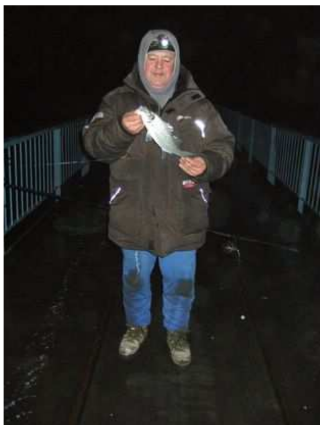
Et un piguet pour finir.