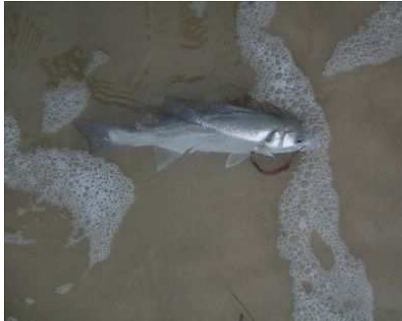
Piqué en bord de gueule, il repartira.