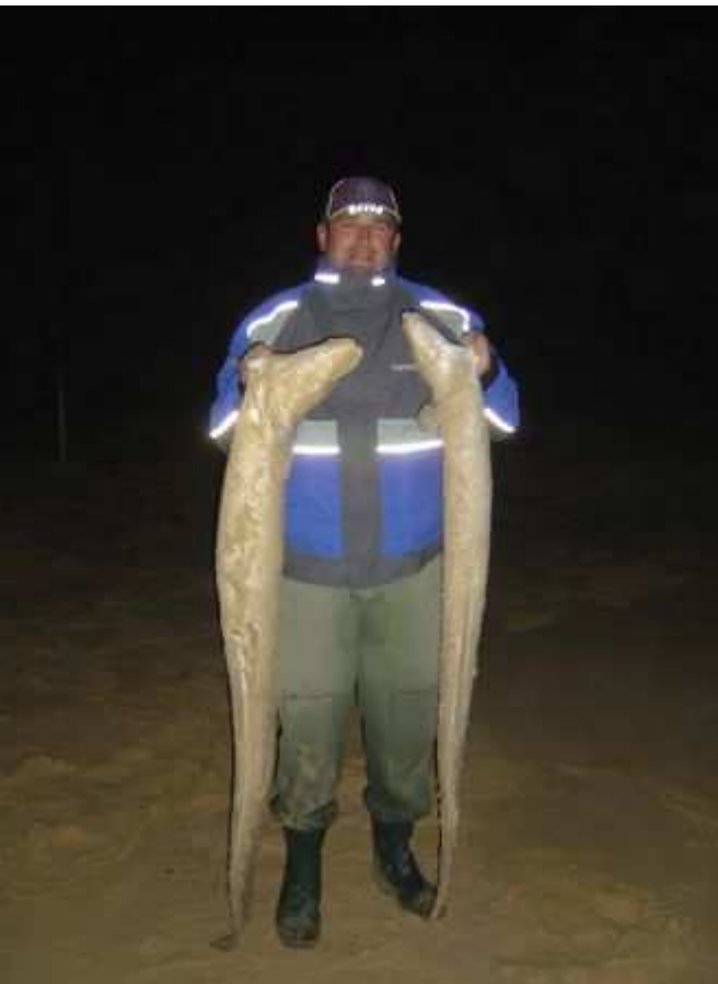
Congre de 6,300 Kg et de 11,200 Kg