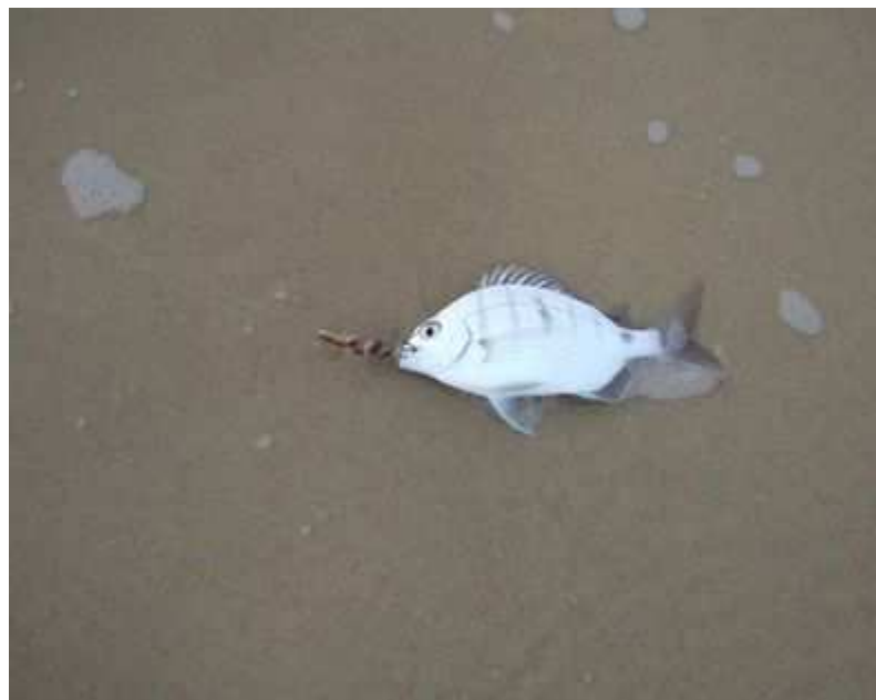
Un petit sar.