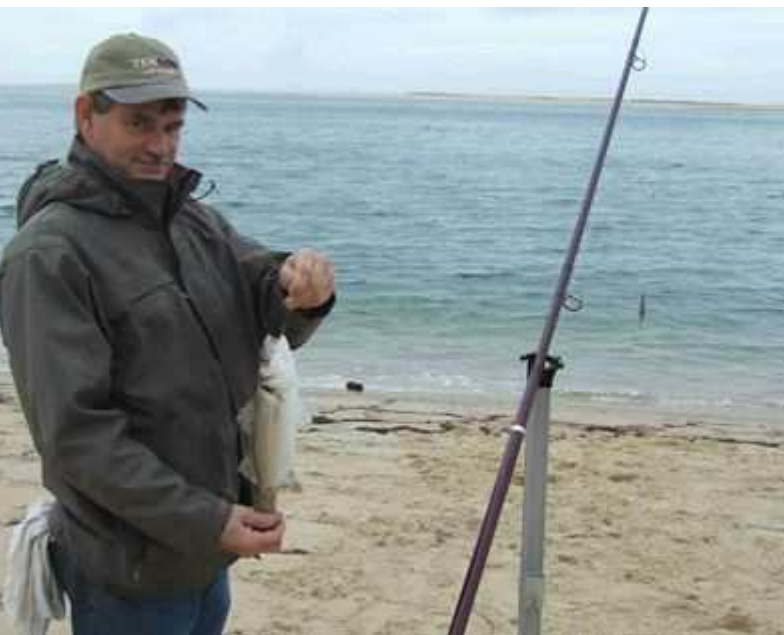
fait pas la taille et il est piqué en bord de gueule : il aura la vie sauve