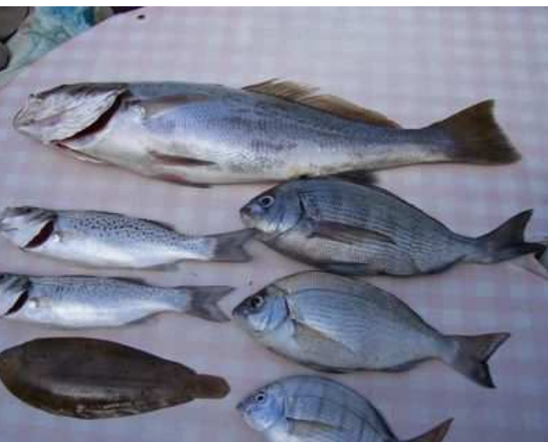
Le maigre, Bars mouchetés, Grisets et la sole.