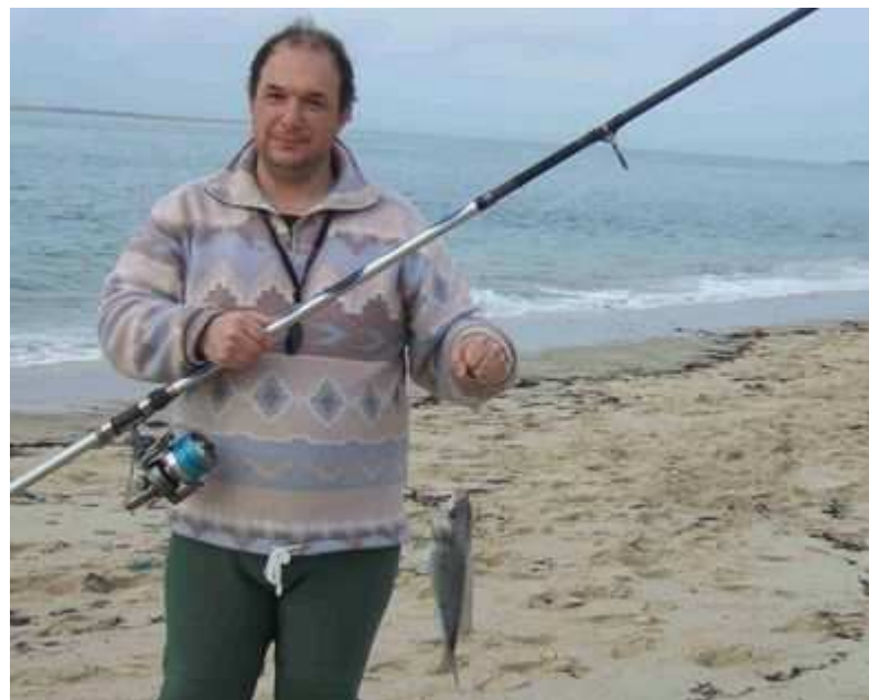
Le griset a tellement tiré sur la canne qu'elle a cassé