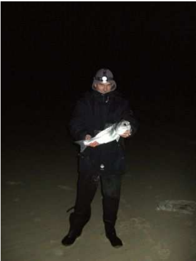
Un beau bar pour finir. .....