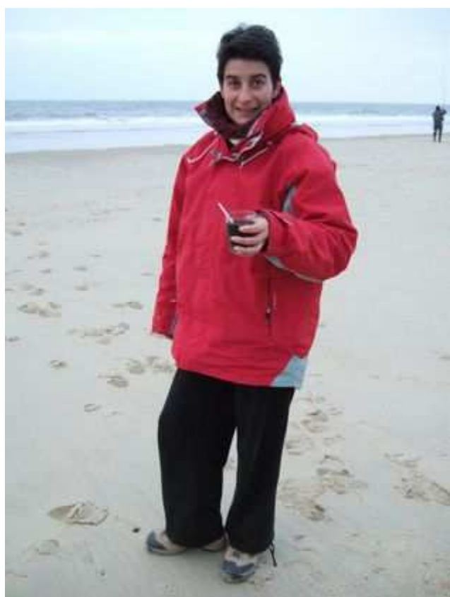
Et un café, un.