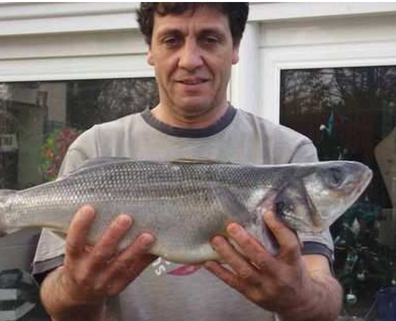
Bar de 63 cm.