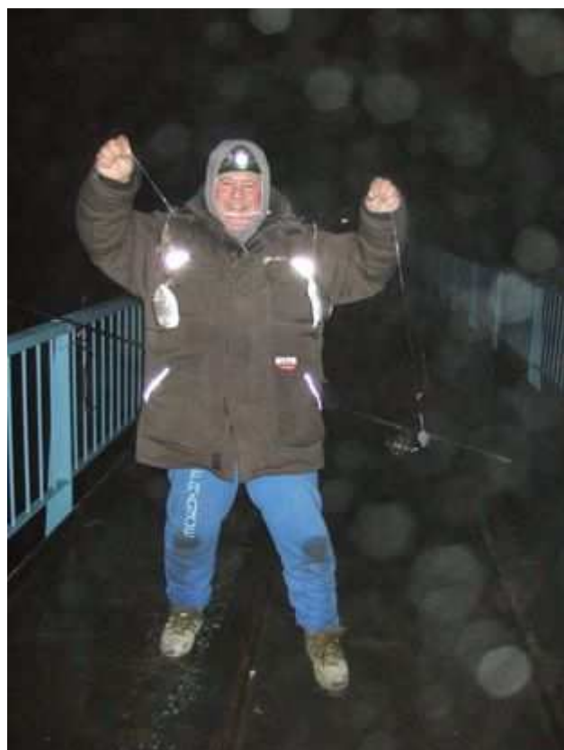
Triplé de sars, ça va encore plus vite.