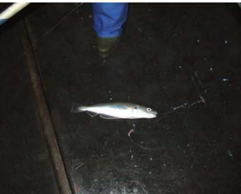
Un joli merlan, on se croirait dans le Nord.