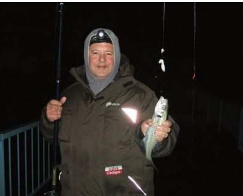
Un piguey pour commencer.