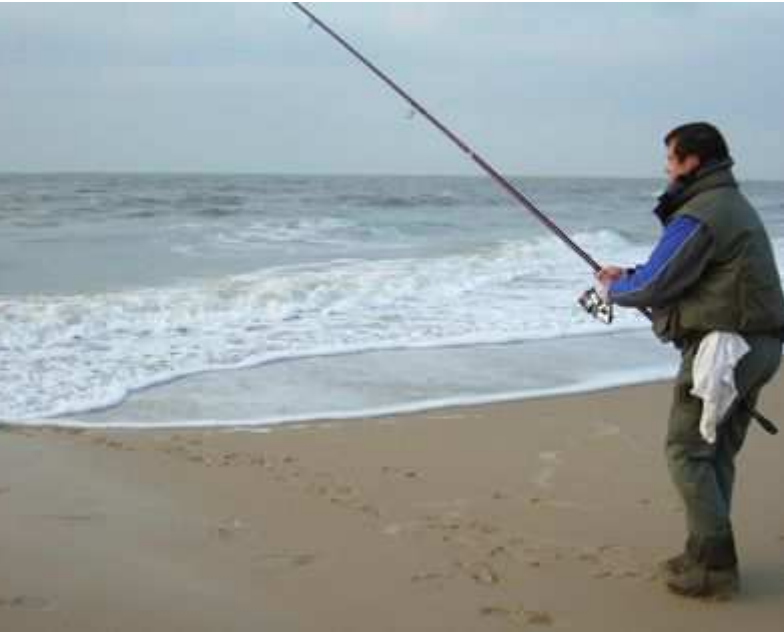
Ah ça c'est plus gros.