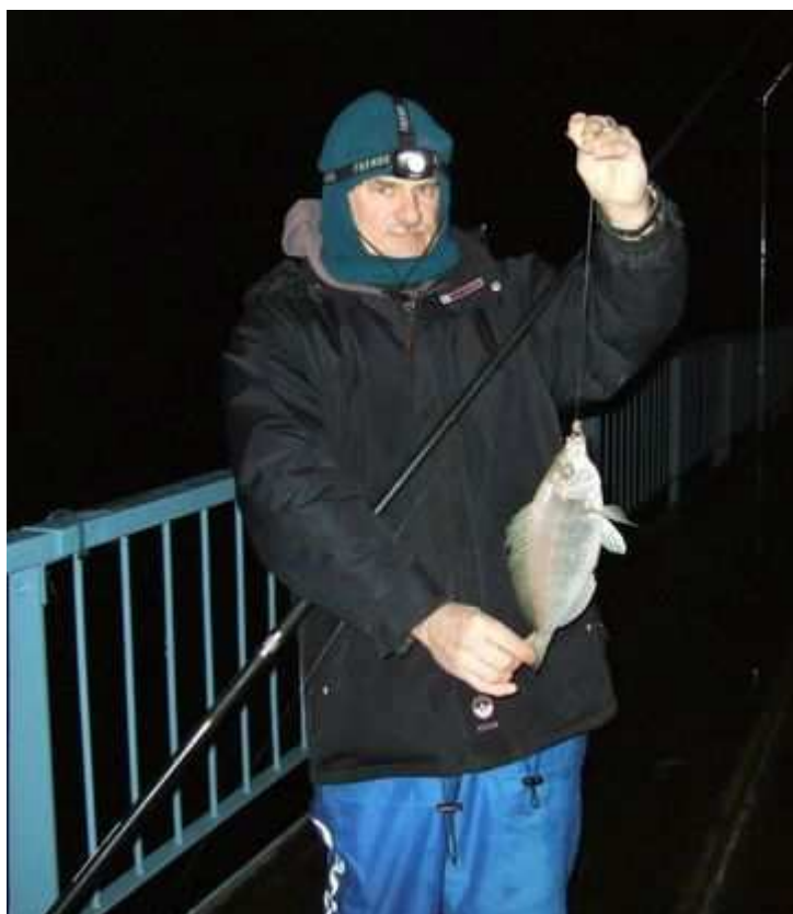
Un griset de 500g.