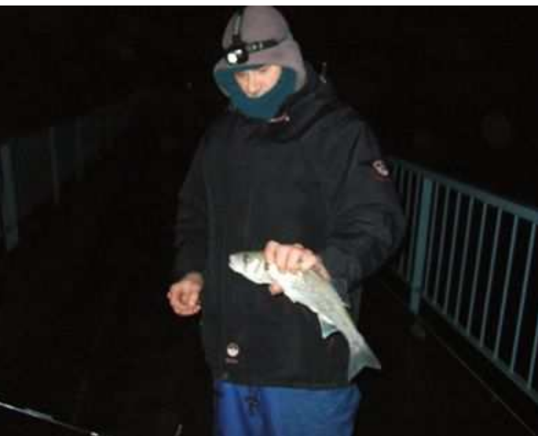
Passage de bar.