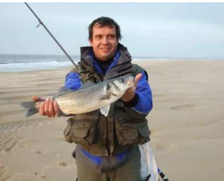
Un peu fier le gars !