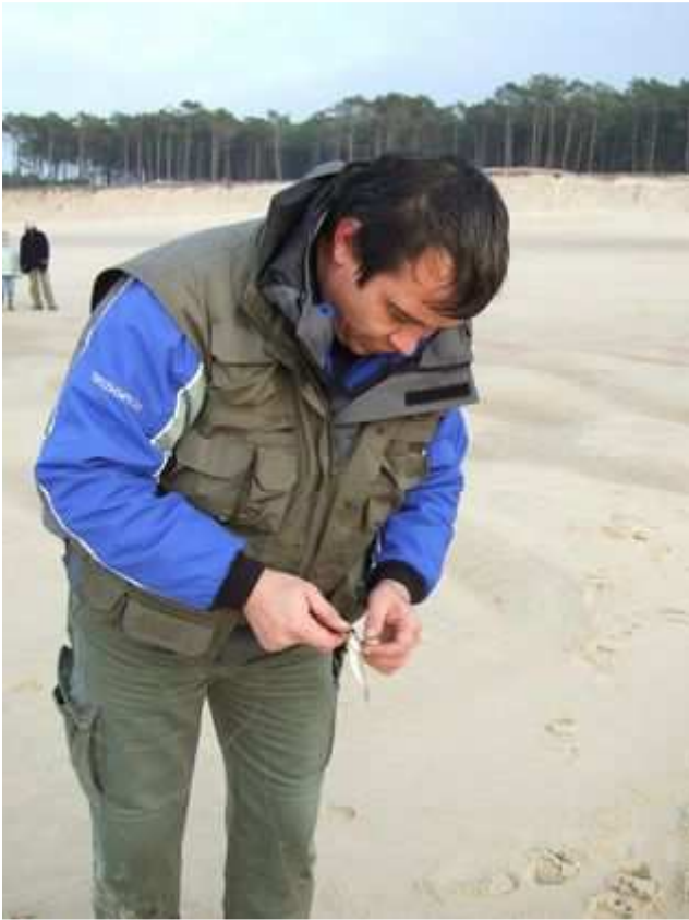
Pas gros celui-là !