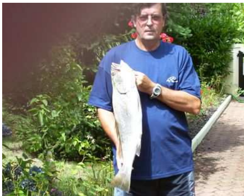
Le maigre, 3,105 Kg - 63 cm.