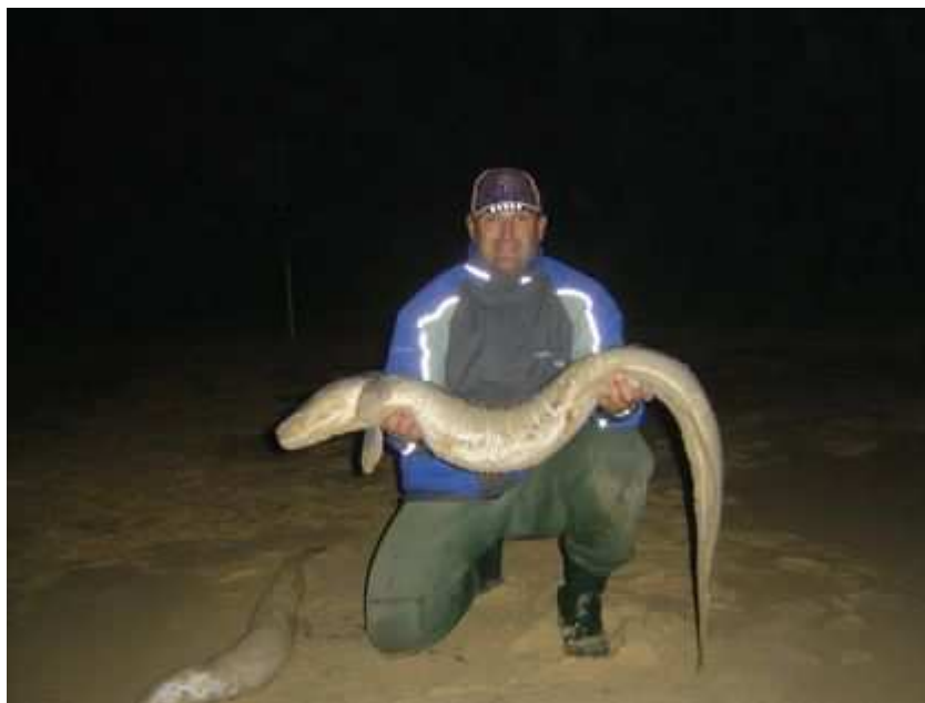
Congre de 11,200 Kg.