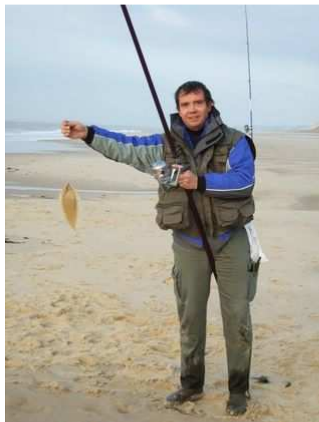
C'est sûr c'est une sole.