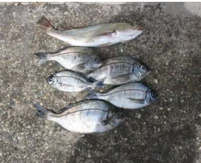
Résultat de la pêche