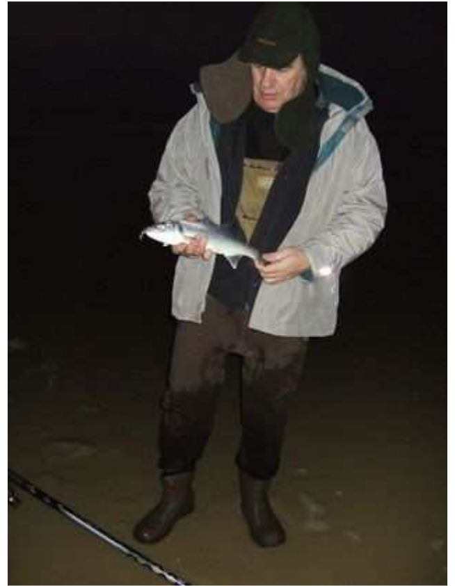
Ah quand même ils arrivent.