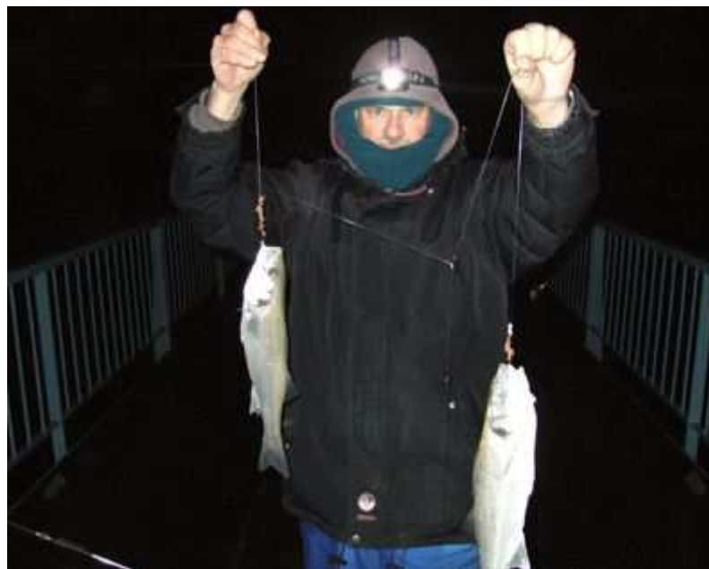
Par 2 ça va plus vite.