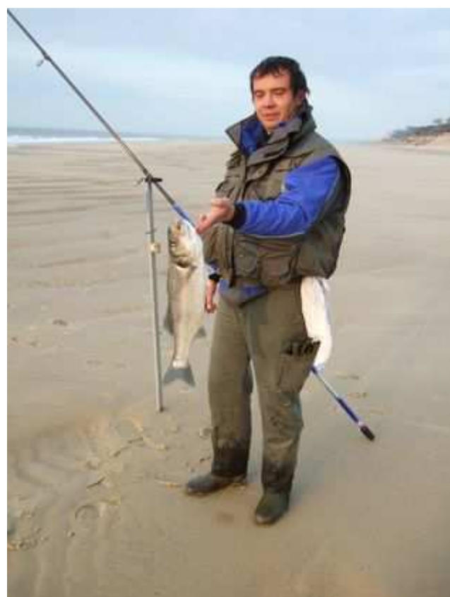
Je vous avez dit qu'il tirait celui-là.