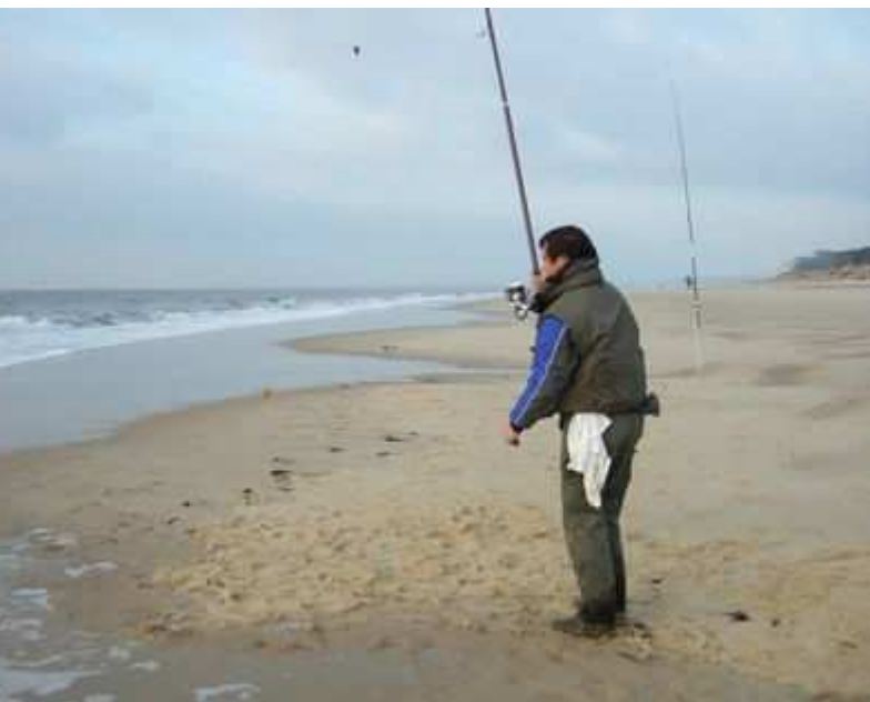
Tiens une sole en décembre.