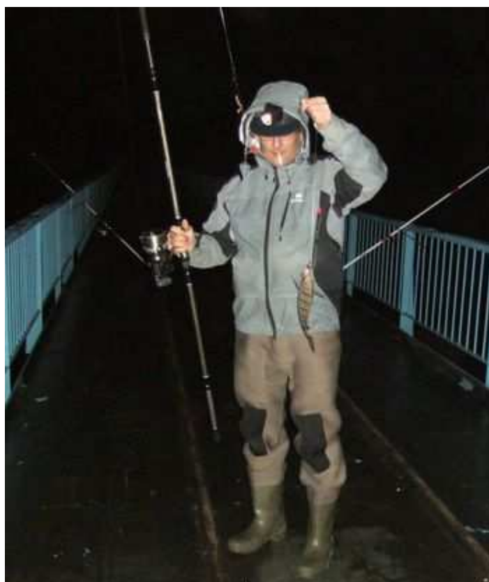
Un petit sar.