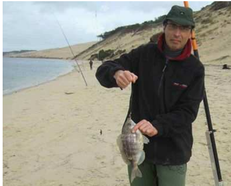
Un joli griset de Gilles