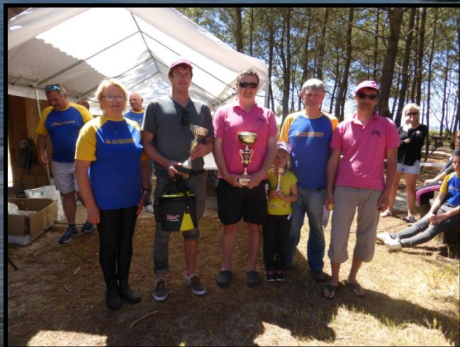
Remise du Challenge Daniel LAVILLE gagné par la Louvine SC

Le concours a rassemblé 145 concurrents venus de 10 clubs du Comité Aquitaine, 3 du Poitou-Charentes et 1 des Hauts de France. 112 pêcheurs ont sorti 68 kg de prises diverses (13 variétés), en majorité grisets, bars francs et rayés.