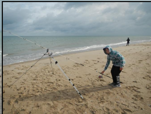
Ewenn SOMBRUN 127 ème